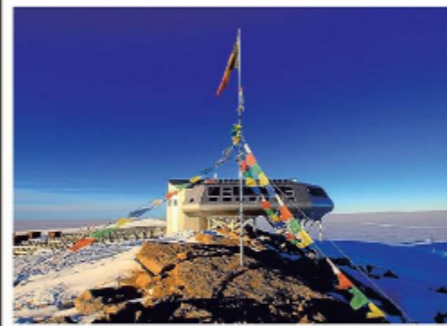
De Prinses Elisabethbasis met Belgische vlag.