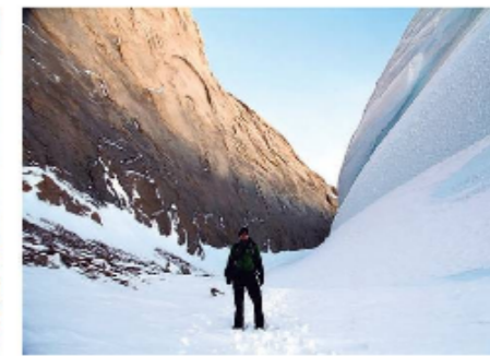
Tussen de immense rotswanden op Antarctica.