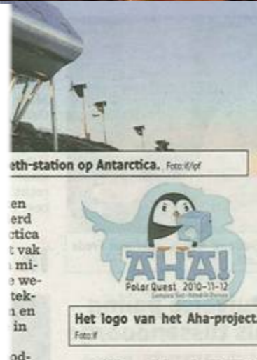
Het logo van het Aha-project.